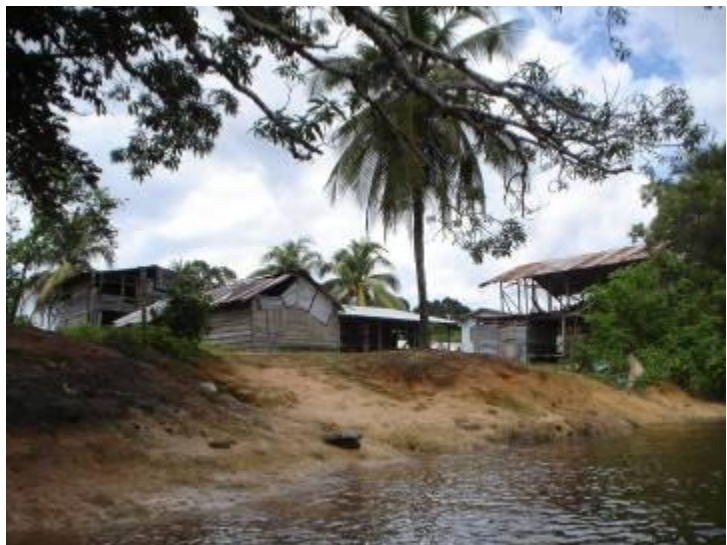
Dorpen langs de Marowijnerivier

Transparant - Het proces van consultatie is open en transparant. Alle opmerkingen en reacties zullen worden vastgelegd.